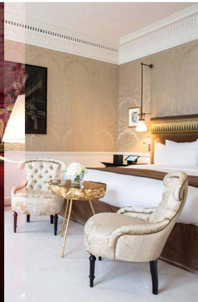
« Un iPad sur la table de chevet pour appeler mon majordome personnel à tout instant, une télévision cachée dans le miroir... L'élégance du XIX e siècle adaptée au XXI e ! » La Réserve Paris · 20 novembre, 11h "An iPad on the nightstand to call my personal butler at any time, a TV cleverly concealed inside the mirror... 19th century elegance tailored to the 21st century!" La Réserve Paris · November 20 th · 11am