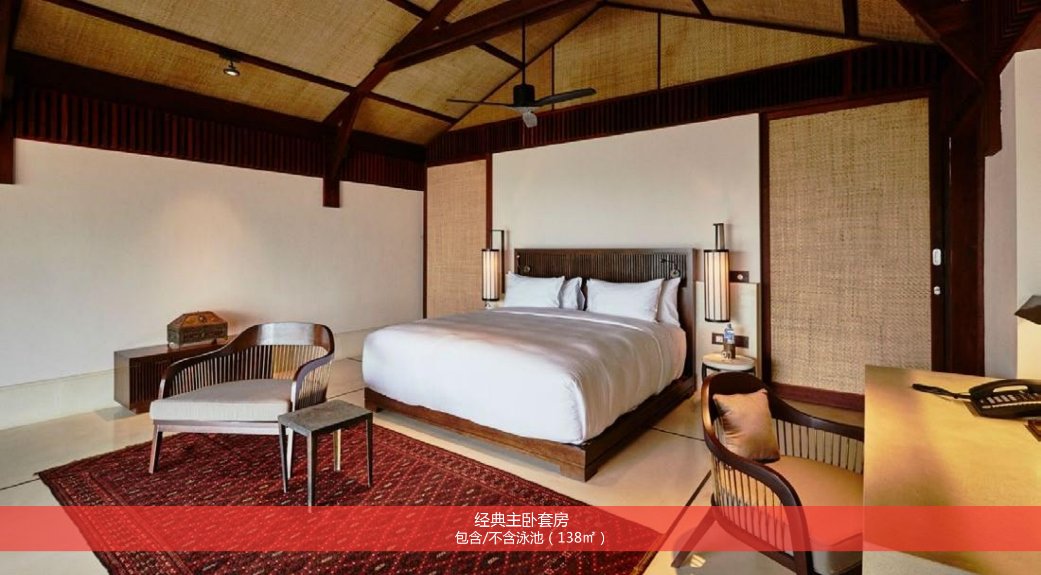
经典主卧套房 包含/不含泳池 (138m 2 )