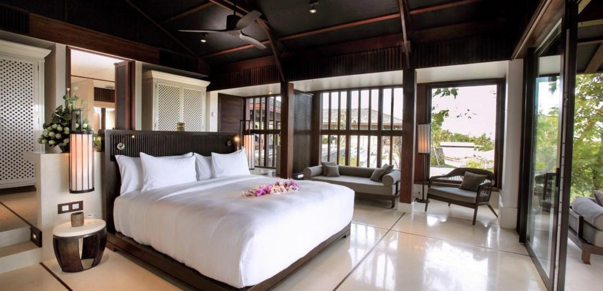
至尊海景套房 包含/不含泳池 ( 97m 2 )