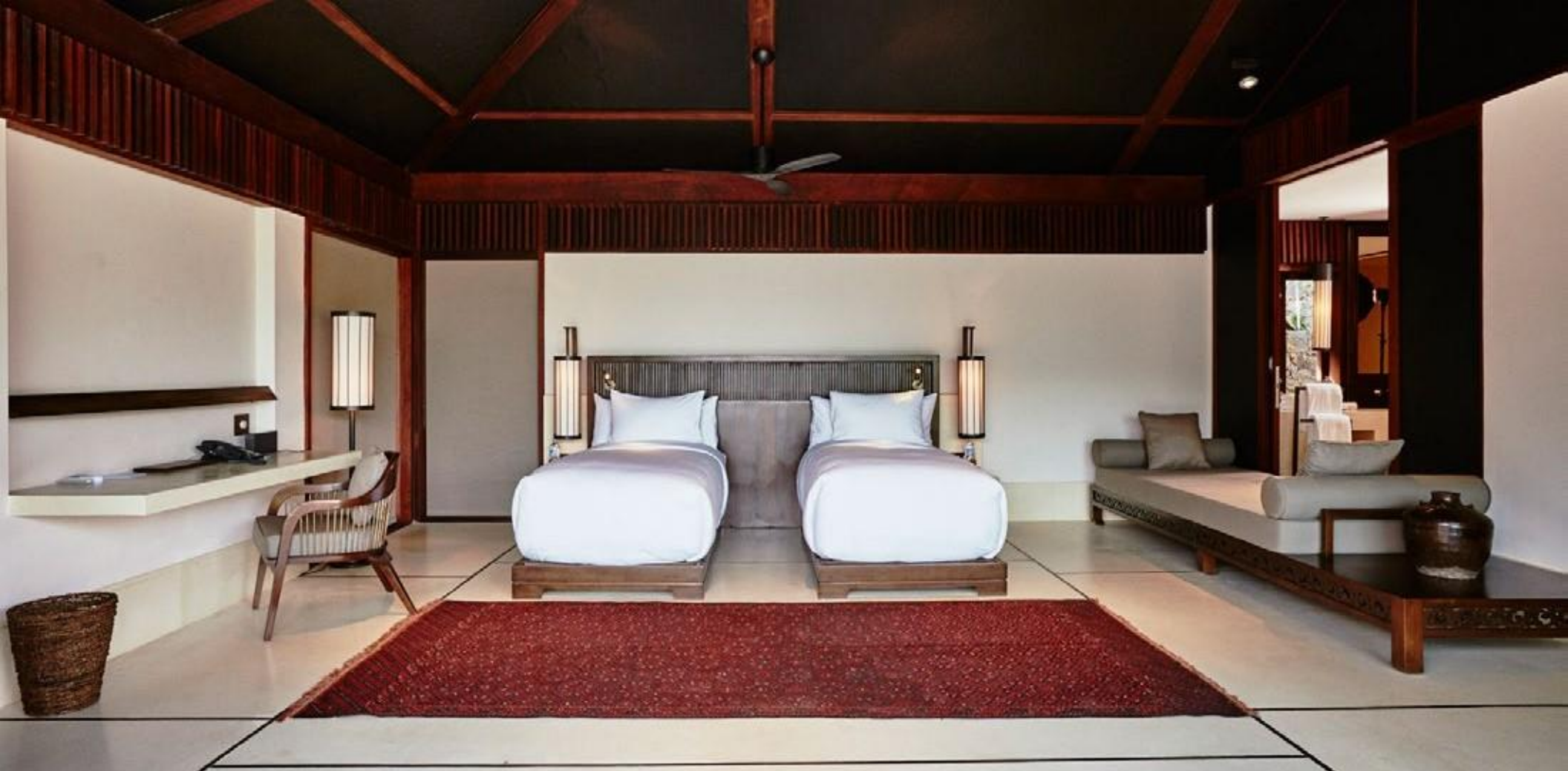
客卧套房 大床/双人床 (64㎡)